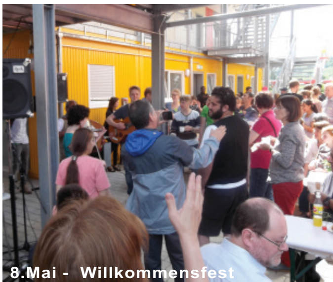
8. Mai - Willkommensfest

Viele waren gekommen, um hallo zu sagen, sich kennen zu lernen, gemeinsam zu essen, zu tanzen und zu spielen. (Renate Schäfer)